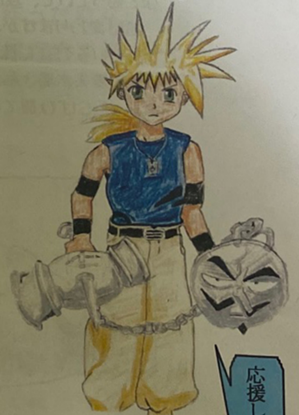
虎水ギンタ (作画タイガー)

★わたくしタイガーは今号をもってみるみるを卒業します。このコーナーは今回を持ってひとまず終わりになります。これからは、仕事にむけて頑張ります!!!ぜひ応援してください!!!★