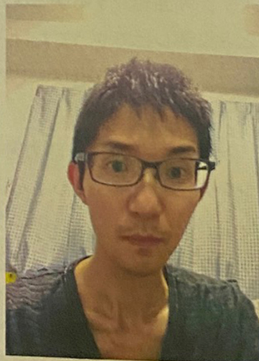
こんにちは、みーるの皆さん。豚です。