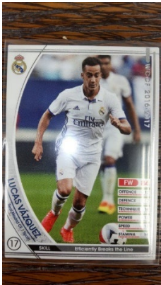
レアルマドリッドのスペイン代表 ルカス・バスケ