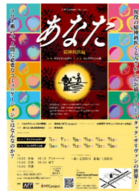
「一人芝居あなた精神科医編」のポスター

モンゴルズシアターカンパニーとみーる食堂が協力して始めていた演劇の営みを途切れないで発展させたい。そう思って、みーる食堂を舞台にしたお芝居を書き続け、もう4作ができあがり、3作が上演されています。私が精神科医として働くなかで出会った様々なエピソードが埋め込まれていますので、どこまでが本当でどこからが作りものかわからないかもしれません。そんないい加減ができてしまうのも、お芝居の楽しさです。ご興味がありましたらぜひ、お芝居のなかのもうひとつのみーる食堂に足を運んでみてください。