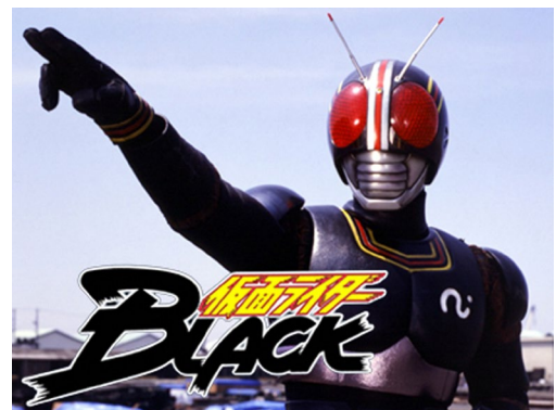
仮面ライダーブラック