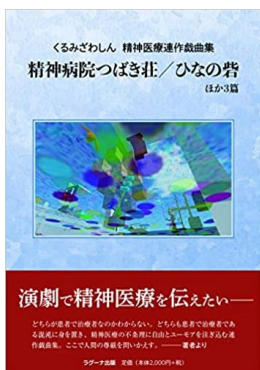
くるみざわしん戯曲集 ／ラゲーナ出版より